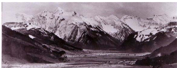
Vor dem Stau: