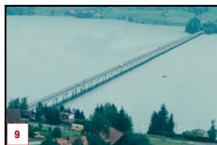
Willerzeller Viadukt 1'115m