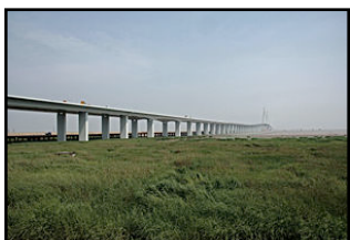
Hongzhou Bay Bridge 36'000m