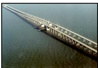
Lake Pontchartrain Causeway 38'422m