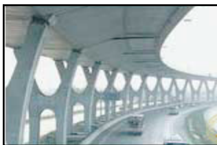
Bang Na Expressway 54'000m

Aufgabe: Zeichne die Längen der Brücke im Verhältnis zur längsten Brücke ein. Schreibe in dein Heft, wie du gerechnet hast.